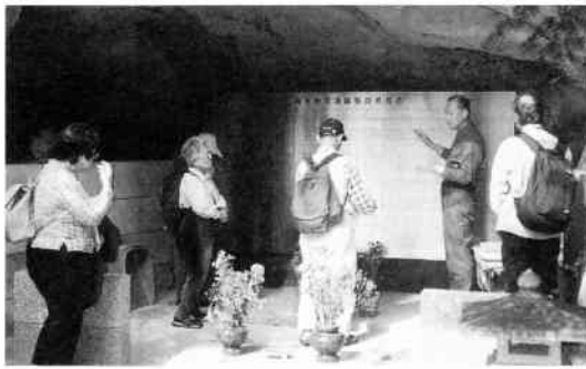
神雷部隊戦没者慰霊碑

国宝館の覚園寺特別展で愉快な?!ものをみつけた。重要文化財の「二神将立像」のそれぞれの頭上にそれぞれ十二支の動物の頭部がちよんと乗っかっているのである。皆で自分の十二支の動物をみつけあい楽しんで。