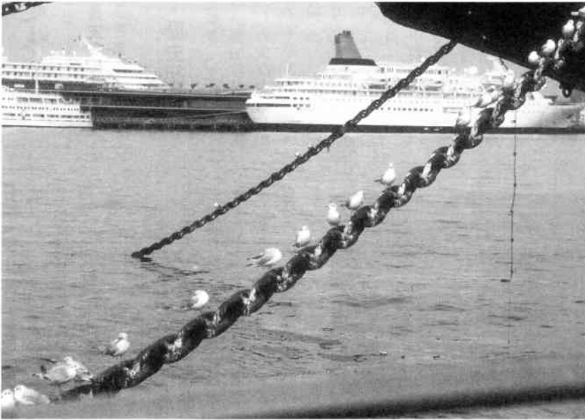
まだ寒いかカモメよ (山下公園)