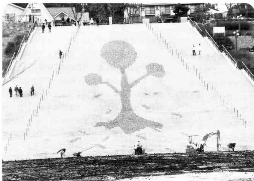
なんでしょう？—秋の宮ヶ瀬ダム