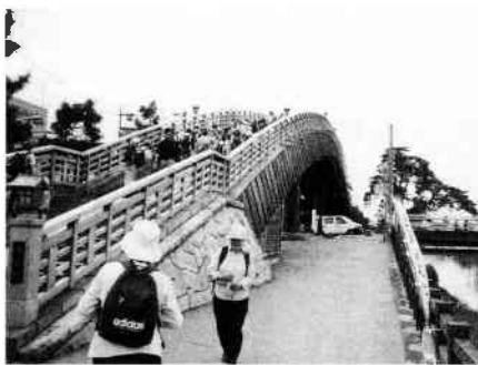
草加市内をいくウォーカー 日光街道シリーズ '03.4.26