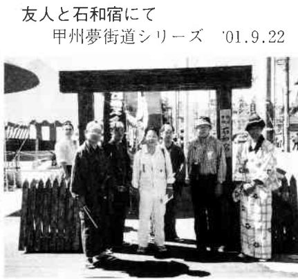
友人と石和宿にて 甲州夢街道シリーズ '01.9.22

教えて頂いている段階ですが、いくつか大きなパーティーでさつそうと踊れることを夢見て努力しております。いずれも六〇才からの手習いばかりですが、できるところまで頑張ってお参りたいと思っております。