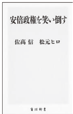
角川新書 2015年7月10日初版

この国を戦争のできる国にしたい安倍によって、笑いが殺される日が来る、いやすでに來ていると思つて