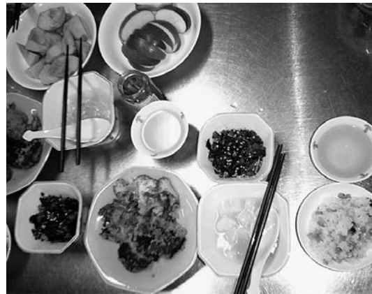
たくさんできました

帰りにはお土産用にバックまで用意され、感謝感激の楽しい料理教室になりました。 (稲本春雄)