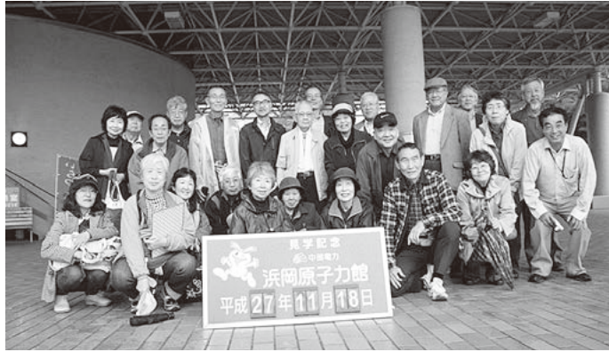
▲浜岡原子力館で記念撮影