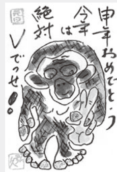
奥津弘久さんの作品