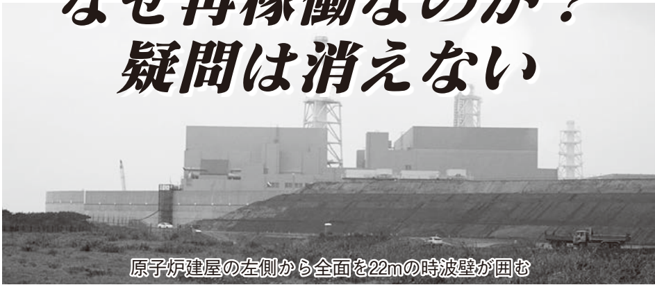
原子炉建屋の左側から全面を22mの時波壁が囲む