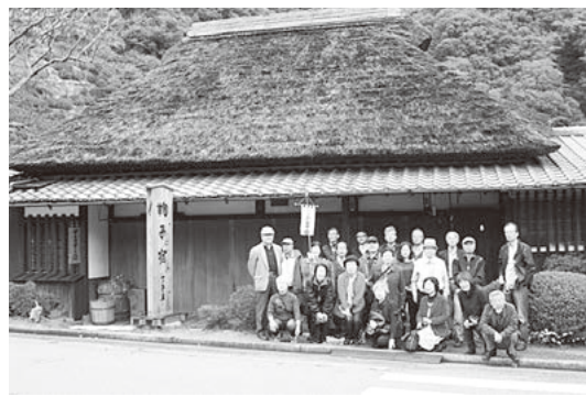
◀慶弔元年(1596)創業の とろろ汁の丁子屋前で

た数万世帯の人々の被害に加え、東名や東海道新幹線という日本の大動脈が遮断され、西風が運ぶ放射能は首都機能を麻痺させること等々、「浜岡」が日本一危険な原発とされる理由が明らかにされた。