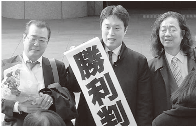
横浜地裁で勝利判決を得る (11月26日)

2014年7月24日、神奈川県労働委員会から「完全勝利命令」が出されてから1年4カ月後の2015年11月26日、横浜地裁は神奈川フイ