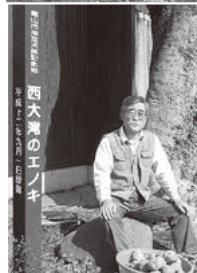
▲飯山市指定天然記念物「西大滝のエンキ」と野菜の収穫物