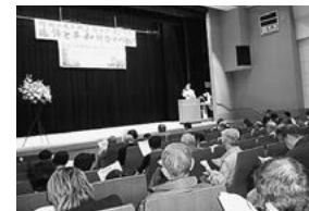
町田の米軍機墜落事件 50周年「追悼と平和像 のつどい」(4月5日、 町田市民フォーラム)

実は、幼児と亡くなられた母親の長女もその後、米軍ジープ事故死しており、重なる不幸に母親の祖父は、「これが憲法の主権国家、平和国家