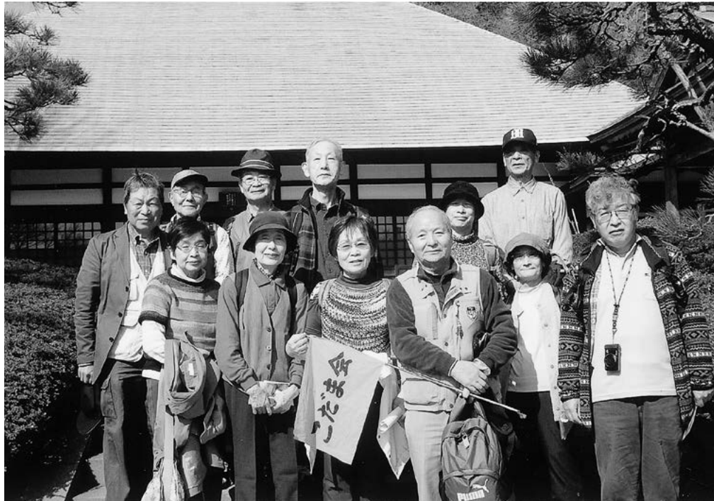
歴史教室・散策「浄妙寺」にて（3月28日）